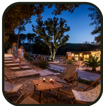
Le camping le soir