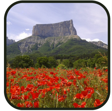
Le Mont Aiguille bucolique...

Hébergés en toiles de tente par groupes de 2 ou 3 de votre choix, nous découvrirons le Triève, au pied du Mont Aiguille.