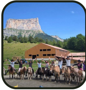
La ferme au pied du Mont Aiguille