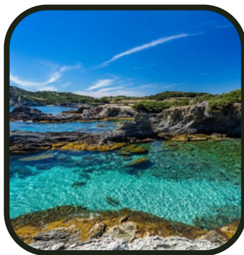
La piscine du coin