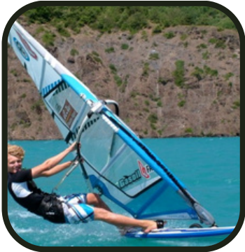
Accroche toi capitaine !