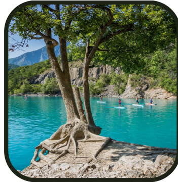
Le lac de Serre Ponçon... et un arbre devant