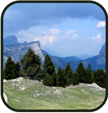
A cheval tu verras la vie comme ça...