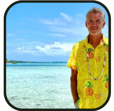
T'es pas à l'abri d'avoir ce genre d'animateur