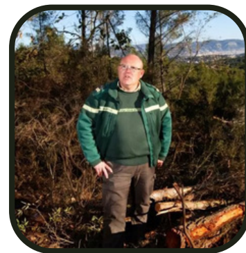
Si tu nous chantes la chanson du garde champêtre, tu gagnes un cadeau !

Oh !!! Tu entends ? C'est les cigales !!!!!